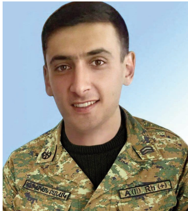
Մեզնից յուրաքանչյուրն ունի երազանքներ, սիրելի հերոսներ, որոնց ցանկանում ենք նմանվել արարքներով, բնավորությամբ ու գործունեությամբ: Սակայն ժամանակը ստիպում է, որպեսզի մենք փոխենք մեր աշխարհայացքը, ինչպես նաև մեր հերոսներից:

44 -օրյա պատերազմը ինձ և շատերին նույնպես ստիպեց փոխել մեր հերոսներին: Այլևս իմ հերոսը ֆիլմից կամ պատմվածքից չէ, այլ իրական, ով իր գործունեությամբ մեծ դեր խաղաց մեր իսկ ապրելու հարցում: