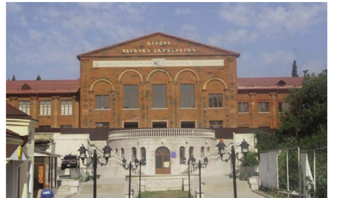
րը: Հավատարմագրման հանձնաժողովի որոշմամբ՝ Արցախի պետական համալսարանին շնորհվեց ինստիտուցիոնալ հավատարմագրում՝ 4 տարի ժամկետով:

Հավատարմագրման հանձնաժողովը քննարկեց փորձագետների զեկույցները հաստատությունների ինստիտուցիոնալ կարողությունների վերաբերյալ, դիտարկեց դրական և բացասական գնահատված տիրույթները, փորձագետների մատնանշած ուժեղ և թույլ կողմերը, հնարավոր ռիսկերը: Քննարկվեց նաև, թե որքանով են իրատեսական բուհի բարելավման ծրագրերը: